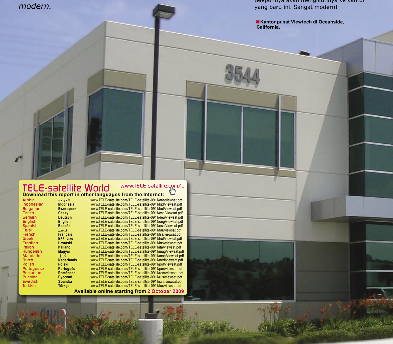
■ Kantor pusat Viewtech di Oceanside, California.

Tidak terdapat saklar lampu. Sensor gerak secara otomatis akan menyalakan lampu di langit-langit. Penutup jendela juga bergerak secara otomatis dan seluruh telepon, Internet dan koneksi satelit terhubung ke satu lokasi pusat. Jika karyawan harus pindah ke lokasi lain, dia hanya perlu melepaskan colokan teleponnya dari lokasi lama dan mencoloknya di lokasi baru; nomor teleponnya akan mengikutinya ke kantor yang baru ini. Sangat modern!