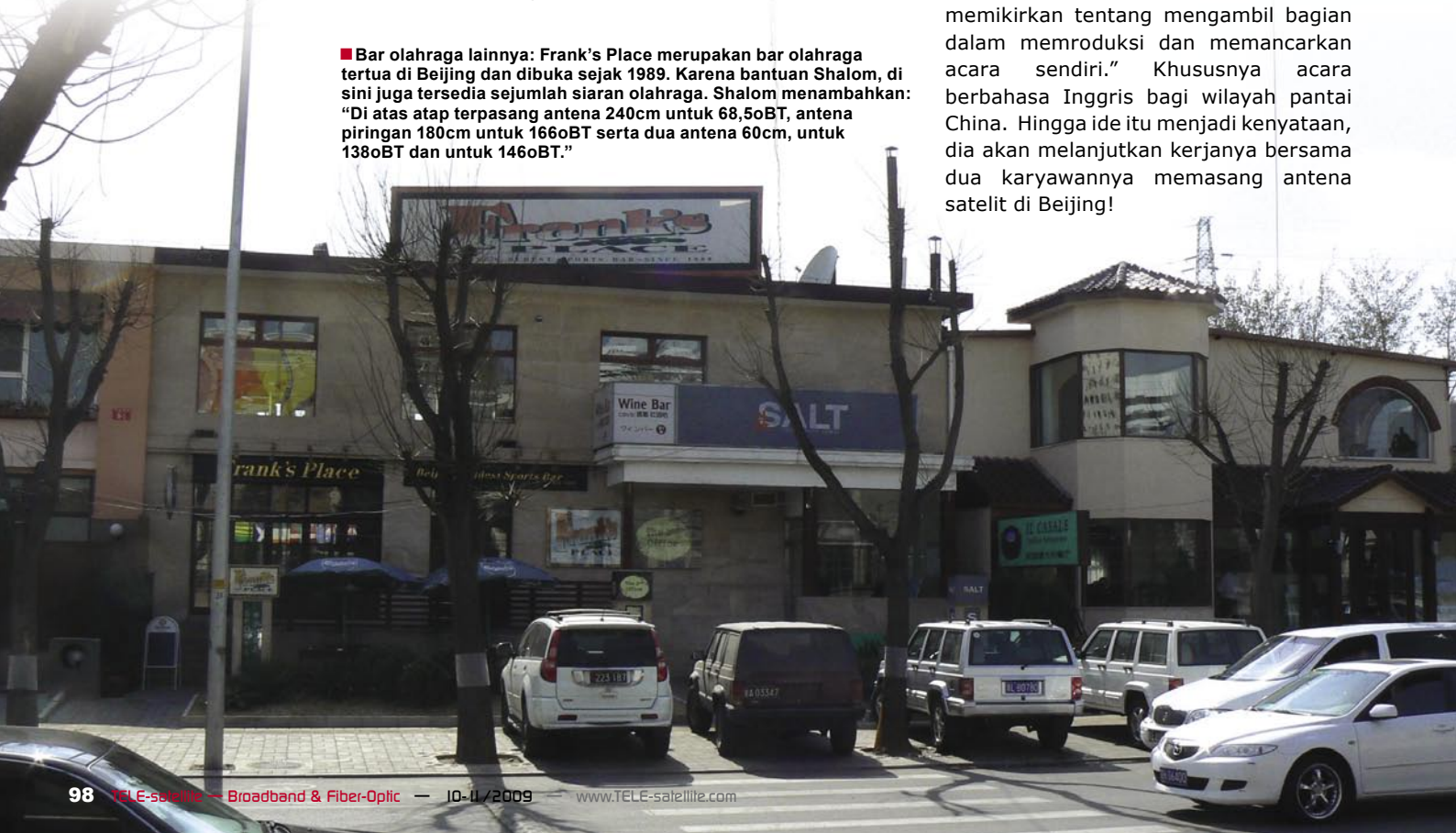
■ Bar olahraga lainnya: Frank's Place merupakan bar olahraga tertua di Beijing dan dibuka sejak 1989. Karena bantuan Shalom, di sini juga tersedia sejumlah siaran olahraga. Shalom menambahkan: "Di atas atap terpasang antena 240cm untuk 68,50BT, antena piringan 180cm untuk 1660BT serta dua antena 60cm, untuk 1380BT dan untuk 1460BT."

dia tuju. Selama masa kuliahnya dia juga mempelajari bahasa Inggris. Dia istirahat pada tahun 1993 ketika dia diundang oleh salah seorang mantan-profesor-nya untuk kuliah satu tahun di Central Washington University di Amerika dan dia diizinkan untuk tinggal di rumah profesornya. Karena keluarga ini adalah Yahudi dan nana China-nya sangat mirip dengan salam Shalom dalam bahasa Yahudi, maka lahirlah nama julukannya itu!