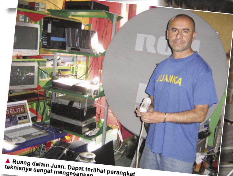
▲ Ruang dalam Juan. Dapat terlihat perangkat tekniknya sangat mengesankan.