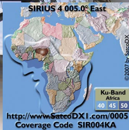
◀ Rencana footprint subsahara dari SIRIUS 4 di 5° BB yang akan diluncurkan pada akhir tahun 2007.