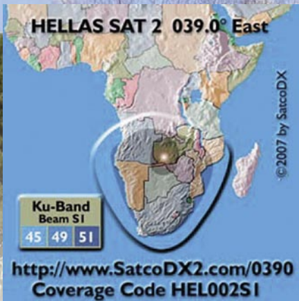
◀ Footprint beam Afrika Selatan dari HELLAS SAT 2 di 39° BT.