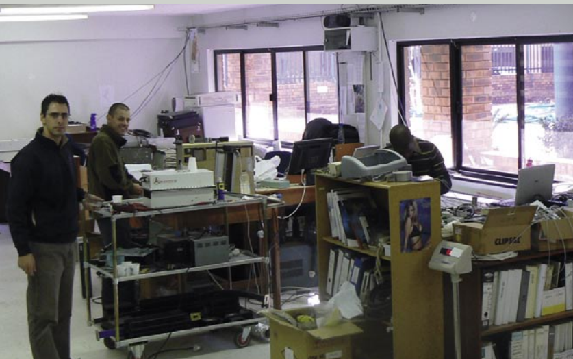
▲ Dengan begitu banyak peralatan elektronik, maka tidak heran jika diperlukan banyak perbaikan. Telemidia mempunyai karyawan yang pekerjaannya memperbaiki perangkat yang rusak.