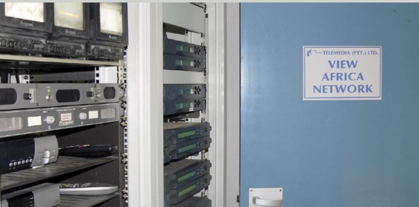
▲ Di sinilah pusat dari paket saluran View Africa: monitor penerimaan dan receiver dapat ditemukan di lemari dari kiri ke kanan tempat berbagai slot encoding untuk semua saluran yang berbeda. Feed untuk banyak saluran yang dihasilkan dari studio yang berdekatan.