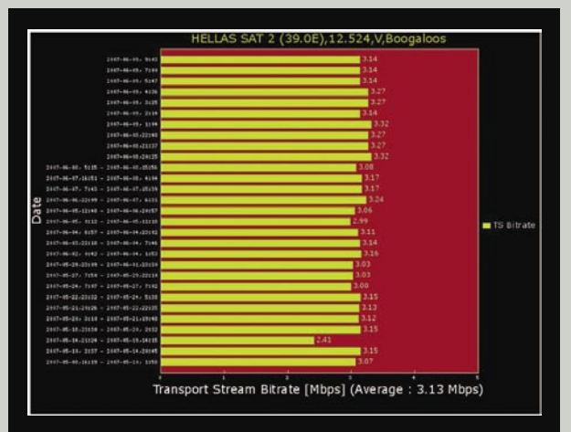
▲ Tampilan bit rate SatcoDX untuk saluran Boogaloo di 12.524V; bagian dari paket acara FTA yang pertama kali ditemukan oleh SatcoDX pada bulan Mei 2007. Yaitu saluran olahraga dengan fokus olahraga ekstrim.