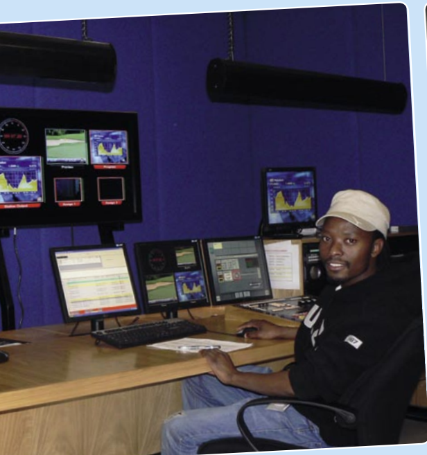
ing operator di Pusat Kendali Akhir. satelit.

Mereka juga merencanakan untuk melanjutkan memancarkan siaran FTA agar dapat menjangkau sebanyak-banyaknya pemirsa. Mereka sangat ambisius!