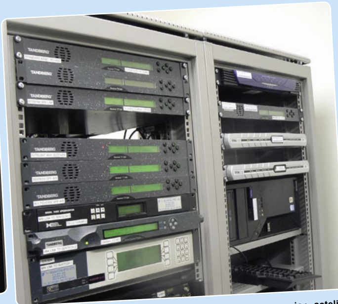
Sinyal diproses di sini. Slot Tandberg untuk pengoperasian satelit. Slot untuk link gelombang mikro ke SENTECH, penyedia layanan Afrika Selatan untuk penyaluran sinyal tersebut.