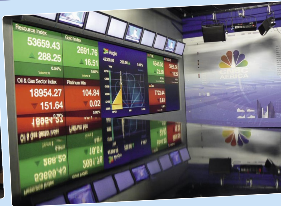
Studio CNBC Afrika