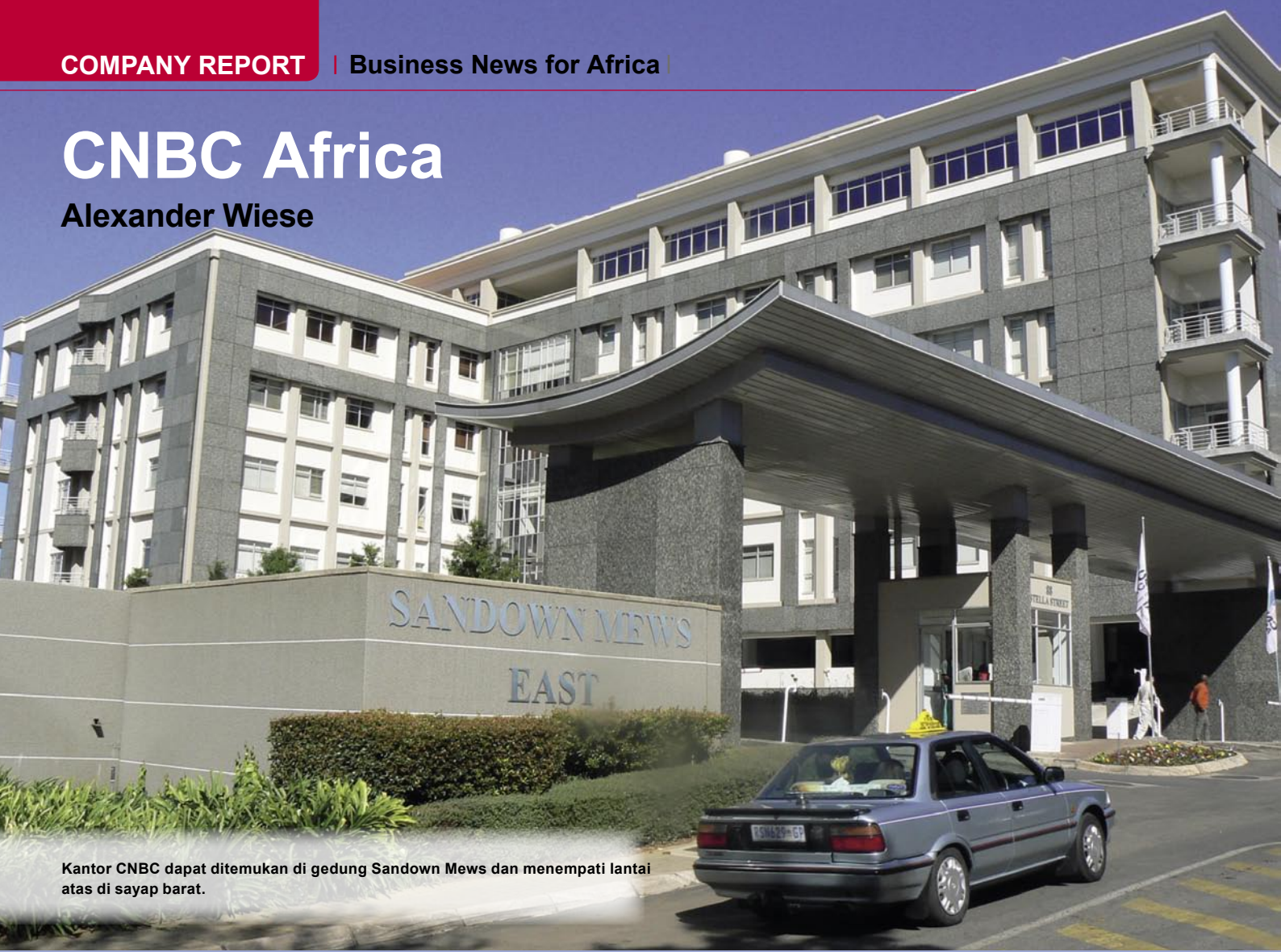
Kantor CNBC dapat ditemukan di gedung Sandown Mews dan menempati lantai atas di sayap barat.