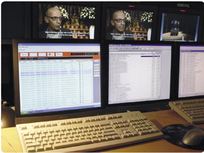
▲ Playout dijalankan secara otomatis: komputer beroperasi pada satu bagian acara secara setelah yang lainnya. Monitor di sebelah kanan menampilkan sistem MPEG-2 lama dari EVS sedangkan monitor di kiri beroperasi dalam MPEG-4 dengan sistem dari pabrik Grass Valley.

"Kami baru saja menerima dua Manager Jaringan untuk saluran HD1 dan EXQI kami. Tugas mereka adalah untuk membuat kedua saluran ini menjadi lebih atraktif dan juga mengadopsi acara untuk ditawarkan ke pasaran Eropa yang berbeda", lanjut Yves Panneels atas pandangan masa depannya.