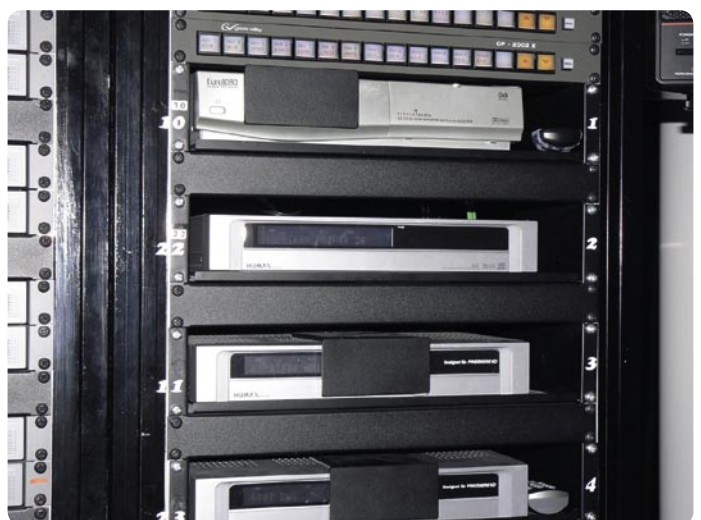
▲ Sinyal transmisi dikendalikan dengan bantuan receiver HDTV standar seperti dari Humax.