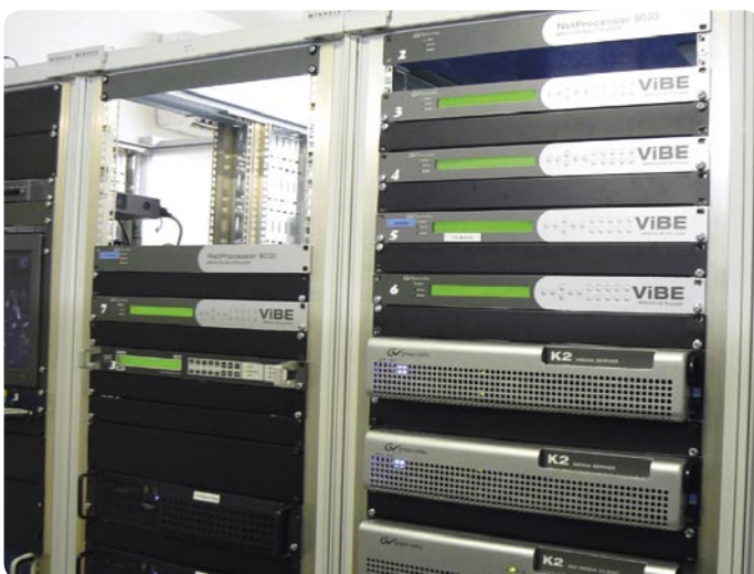
▲ Siaran diproses di sini dalam MPEG-4 dan disalurkan ke Uplink.

Apa lagi yang kita harapkan dari Euro1080? "Kami juga sedang melakukan konversi audio menjadi AC3 dan kami juga segera akan dapat memperluas EPG menjadi 14 hari," komentar Jacques Schepers. Yves Panneels menambahkan, "Hal ini akan memungkinkan kami untuk membuat informasi acara jangka panjang tersedia untuk publik." Ini merupakan langkah penting dalam membuat saluran Euro1080 menjadi lebih atraktif!